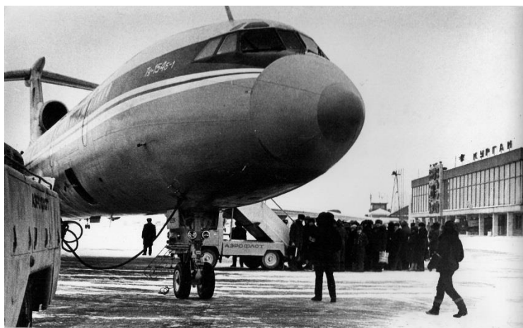
Аэропорт Курган, посадка в самолёт Ту-154, 1985 г.