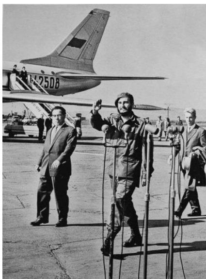
Прилёт Фиделя Кастро. Аэропорт г. Свердловска, 1963 г.