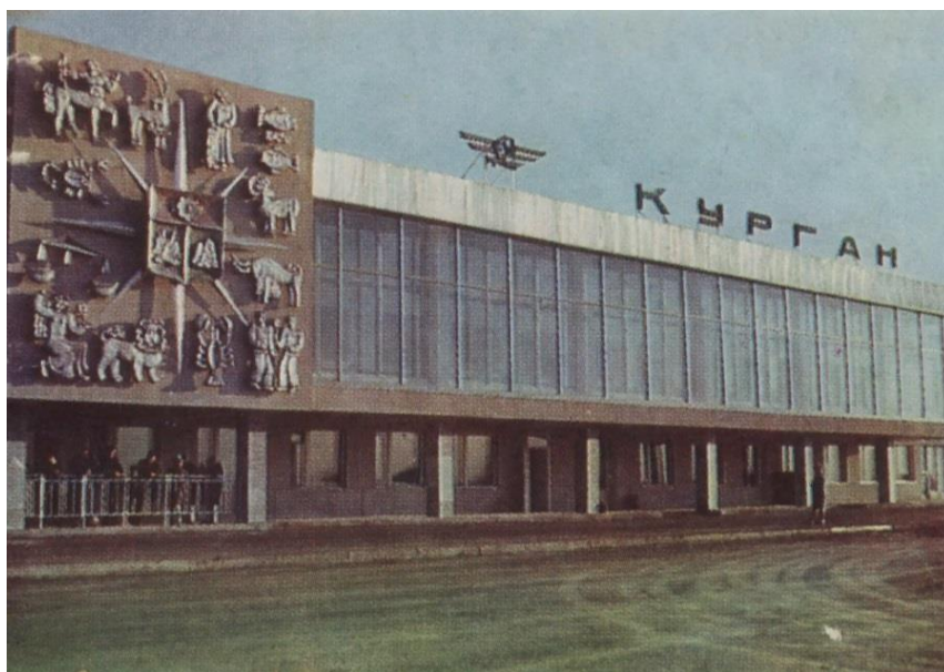
Аэропорт Курган в 60-е годы