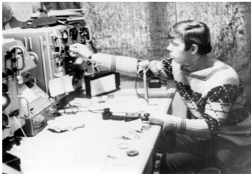
Рабочее место диспетчера ВРДП Ивдель, 1972 г.