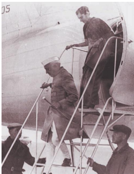
Встреча индийской делегации Джавахарлал Неру и Индира Ганди 17.06.1955, посадочная площадка "Зелёное поле" (г. Магнитогорск)