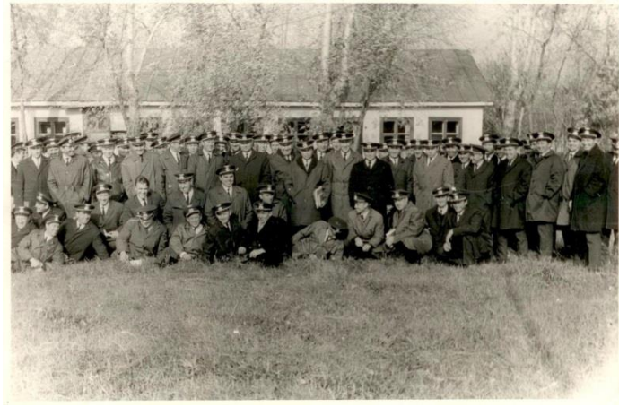
120-й лётный отряд г. Свердловска