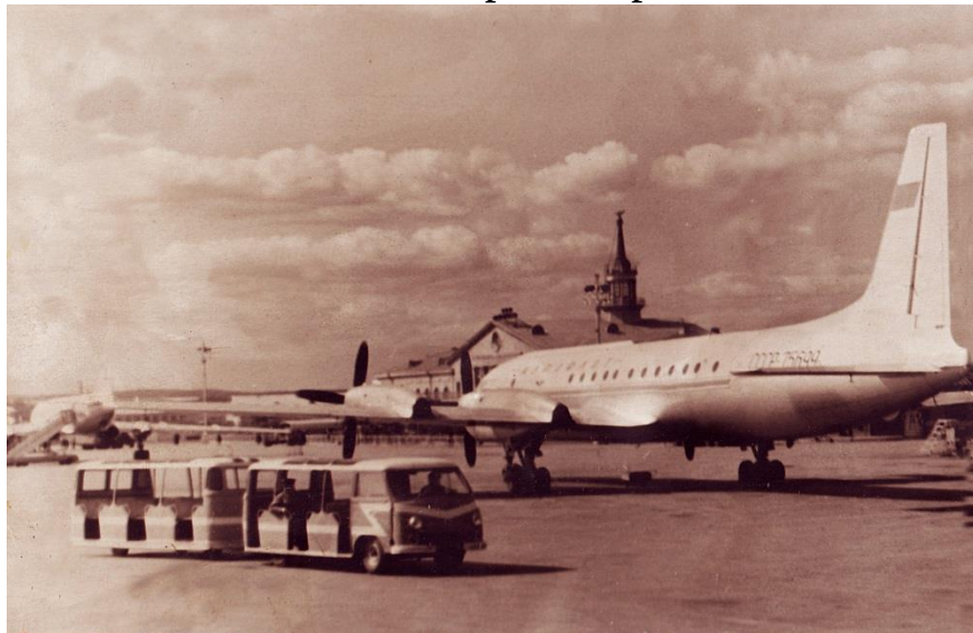
Ил-18 в аэропорту Кольцово, 1965 г.