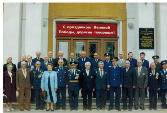
Ветераны Великой Отечественной войны и служащие Управления в день Победы, 1995 г. и 2000 г.