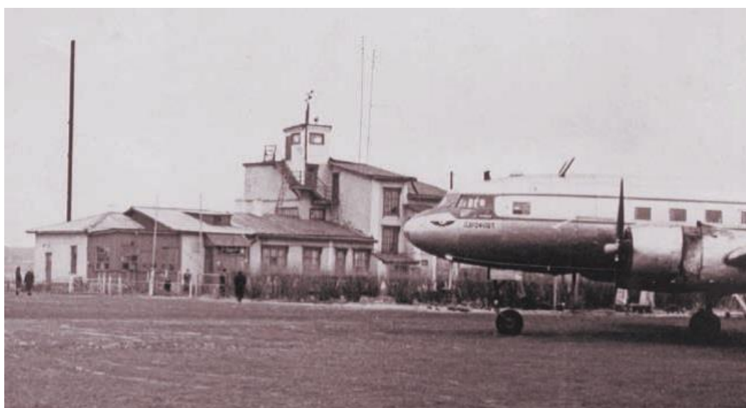
Ил-14 на перроне аэропорта Магнитогорска, 1963 г.