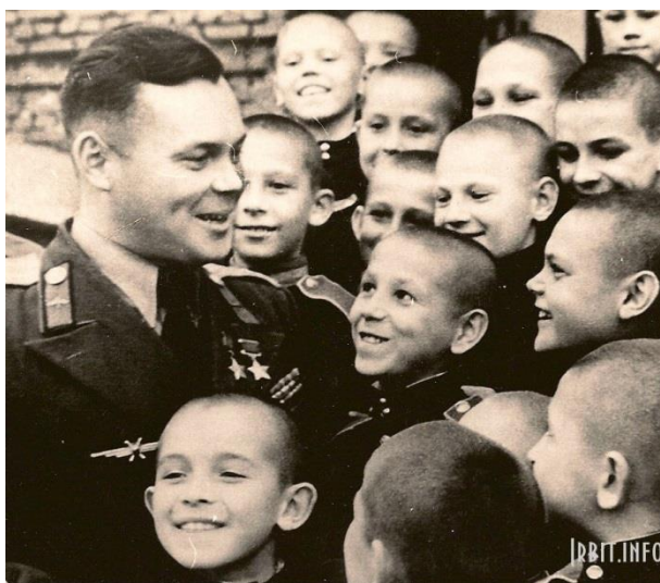
Дважды герой Советского Союза Речкалов на встрече с учащимися Свердловского Суворовского училища