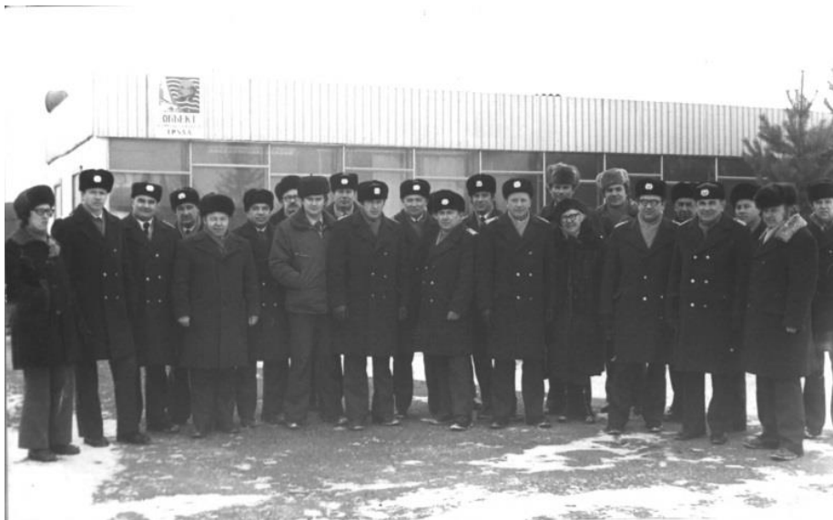
Совещание руководителей служб ЭРЛОС Уральского Управления Гражданской авиации на базе позиции трассового обзорного радиолокатора Пермского авиапредприятия, 1983 г.