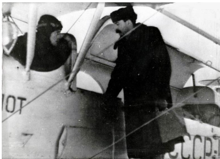
Гавриил Илизаров перед полётом на ТУ-2 в 50-е годы. Аэропорт г. Кургана